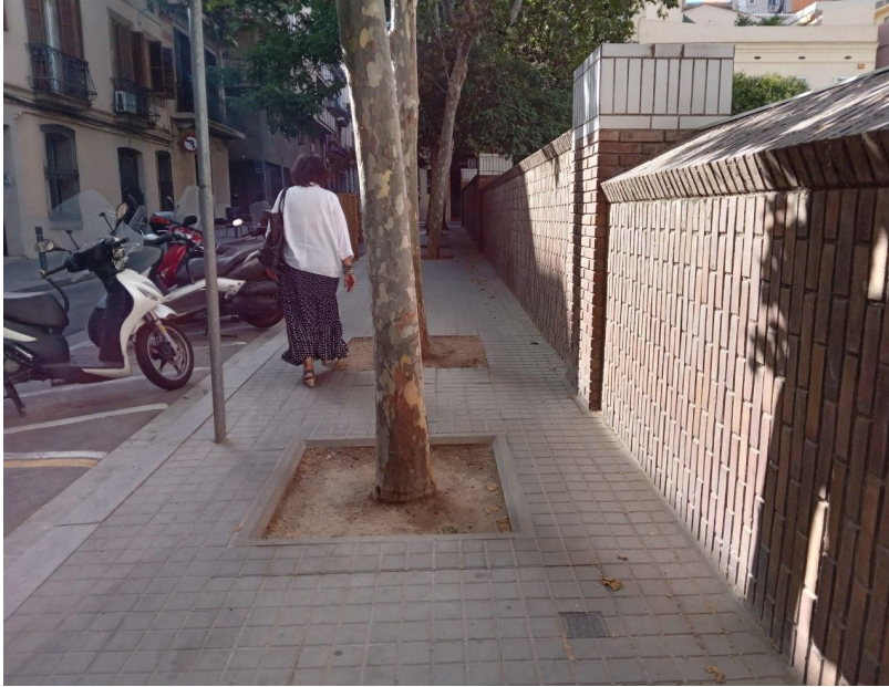
Carrer Alfons XII (F3)